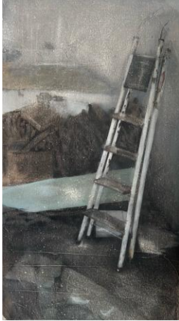
pena. , 2025 Óleo sobre tela 137,50 x 73 cm