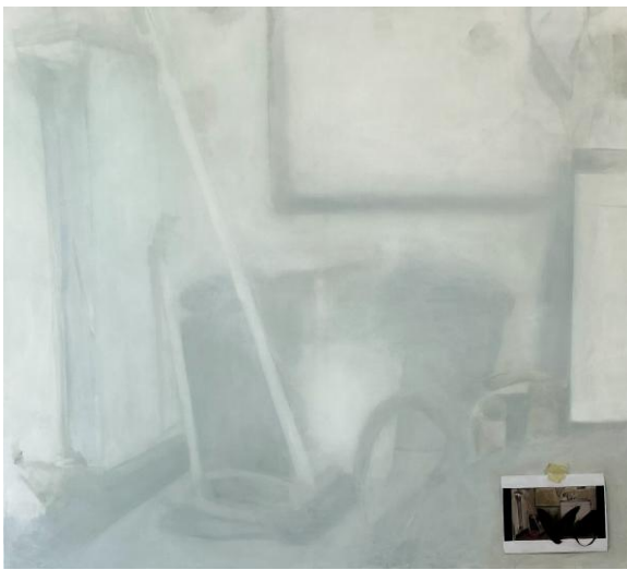
as cicatrizes não me impedem de repetir , 2025 Óleo sobre tela 180 x 160 cm