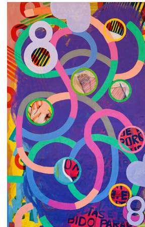
4 | 174 x 111 cm_B