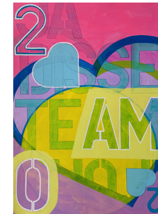
8 | 42 x 29,7 cm