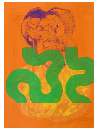
10 | 29,7 x 21 cm