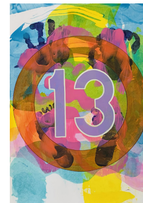
11 | 29,7 x 21 cm