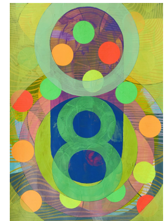
6 | 42 x 29,7 cm