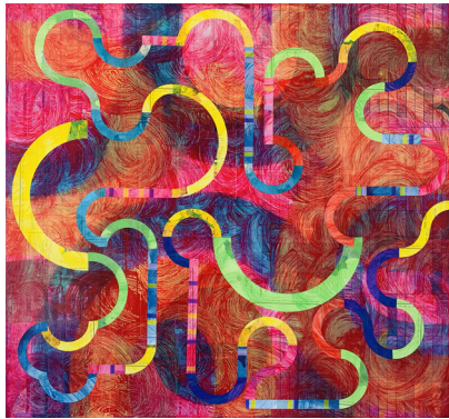
2 | Alice's Upside-Down Expedition