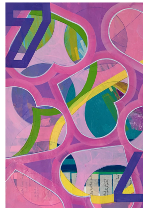
7 | 42 x 29,7 cm