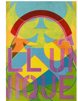
9 | 42 x 29,7 cm