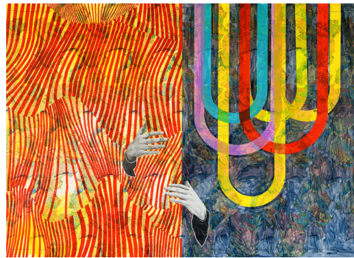
3 | Almd-1

O meu processo artístico tem origem na realidade, partindo dela como ponto de partida e regressando a ela como ponto de referência. A partir do real, extraio elementos temporais, espaciais e experiências emocionais que, posteriormente, são reinseridos na pintura. Este processo de extração e reinserção testemunha as marcas da manualidade, mediada pelo suporte onde a expressão artística se manifesta. Isto resulta num estado contínuo de transformação, um “devir in-process”, onde a pintura está em constante evolução, assim como as próprias vivências e emoções que a inspiram. A exposição “Landscapes of Dream and Reality” convida o observador a explorar a interseção entre o tangível e o sublime, onde cada obra representa um ponto de encontro entre o mundo real e as percepções subjetivas.