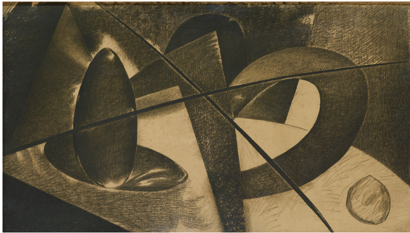
Nikias Skapinakis_Natureza II