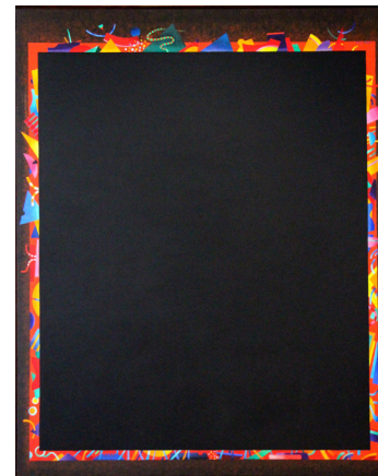
Nuno Barreto_Noturno III