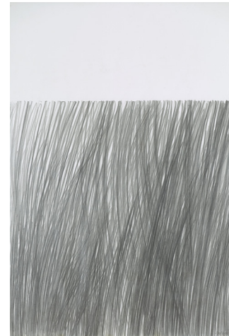
Zulmiro de Carvalho_Sebe