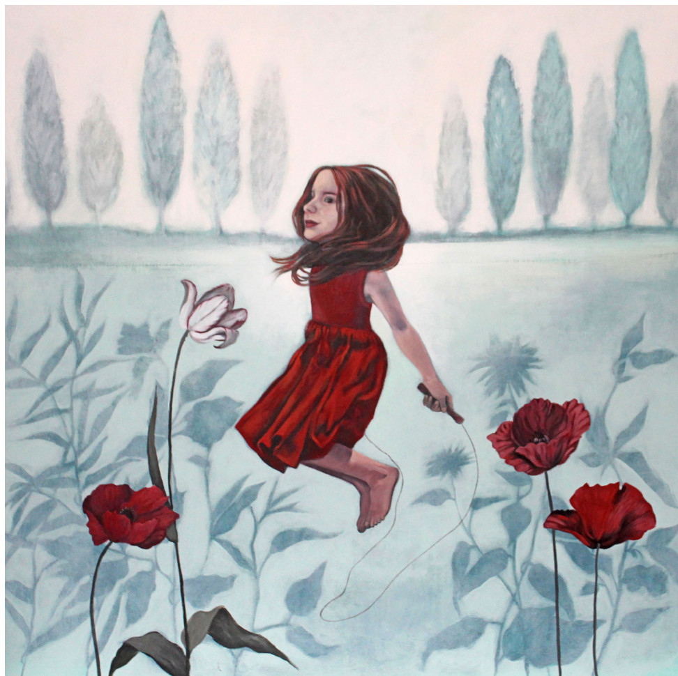
De tarde... , 2025, Acrílico sobre tela, 145 x 145 cm